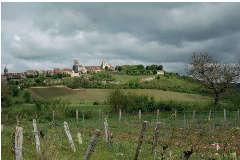
Gezicht op Vézelay